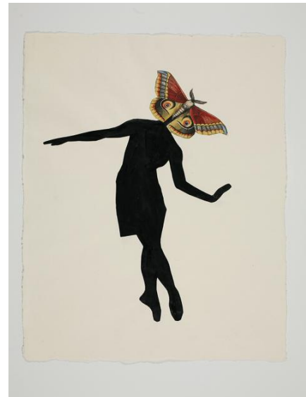
Schmetterling | 2013 | Collage, Mischtechnik auf Papier | 40x30 cm | (c) Zenita Komad

Zenita Grad, Regina Gallery, Moscow, Russia