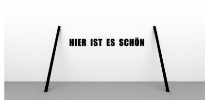
Melitta Moschik | HIER IST ES SCHÖN | 2014 | Aluminium, Acrylglas, Laserschnitt | 240 x 400 x 20 cm | Ausstellungsansicht