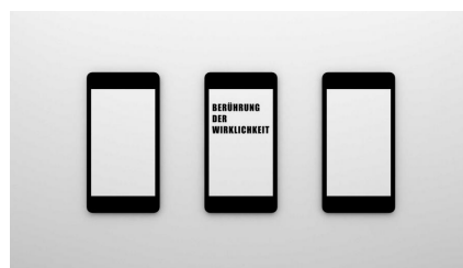
Melitta Moschik | Berührung der Wirklichkeit | 2014 | 3-teiliges Wandobjekt, Acrylglas, Folie | 125 x 65 x 3 cm