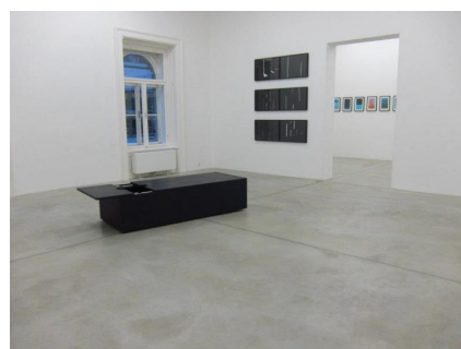
Installation View | Rainbow Country 2012 | Galerie Zimmermann Kratochwill | Innenansichten & untitled (headbox)