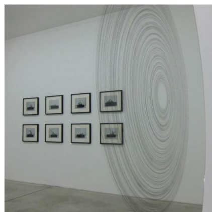
Installation View | Rainbow Country 2012 | Galerie Zimmermann Kratochwill | untitled (mirror) & untitled (headbox)

Rejection, Ve.sch, Verein für Raum und Form in der bildenden Kunst, Wien