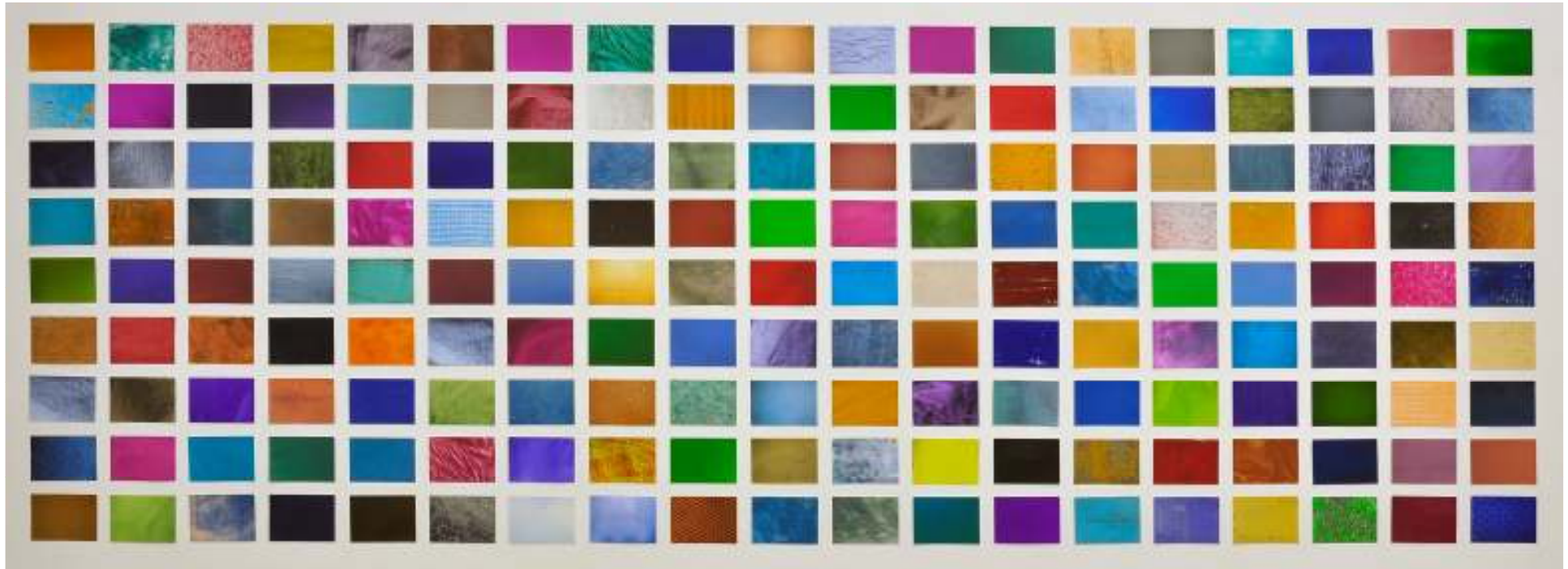
untitled pantone | 2011 | 198 c-print on endura paper | unique

MM Yu's Fotografien zeigen eine Ästhetik der Dinge und des alltäglichen Tuns und Geschehens - mag es noch so fragwürdig sein. Sie setzt Fotografie zur Abbildung der Realität ein. Konsequenterweise dokumentiert sie anhand alltäglicher Bilder Manilas das Leben an der Schwelle zur Globalisierung.