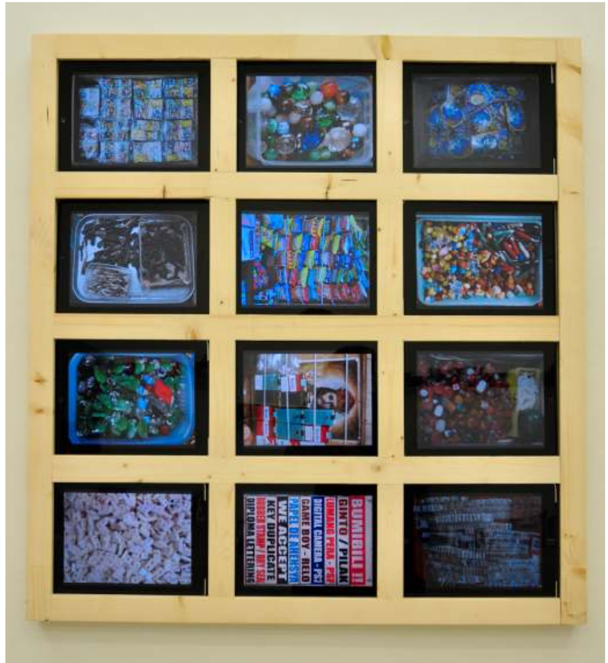
Inventory | 2011 | multi media installation (12 iPads) | edition: 3 | 90x86 cm

Teil der Ausstellung ist eine Installation mit 12 iPads, welche, wie ein Fenster installiert, den Besucher zur direkten Interaktion mit Yu's Arbeit auffordern. Jeder iPad wird mit 12 Images geladen, der Betrachter kann seine eigene Komposition schaffen und variieren. Sie thematisiert mit dieser Arbeit die postmoderne Computer- und Medienkultur.