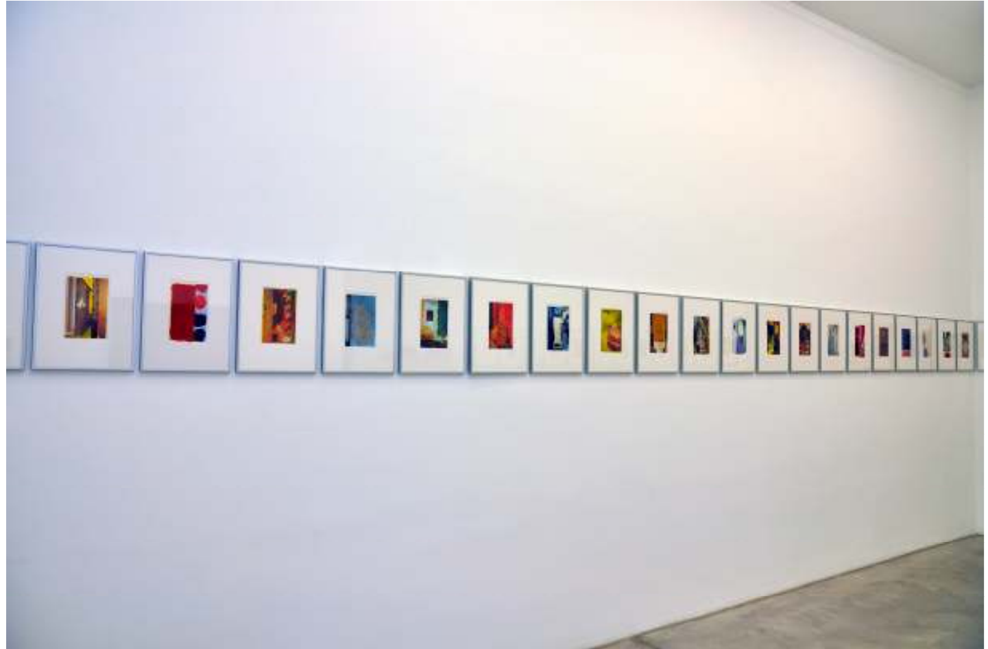
variable series | 2003/2011 | mixed media on paper, collage | variable size

Die Künstlerin lebt und arbeitet in Manila (Philippinen) und wurde für ihre Arbeit mehrfach ausgezeichnet. inventory ist die erste Einzelausstellung von MM Yu in Europa.