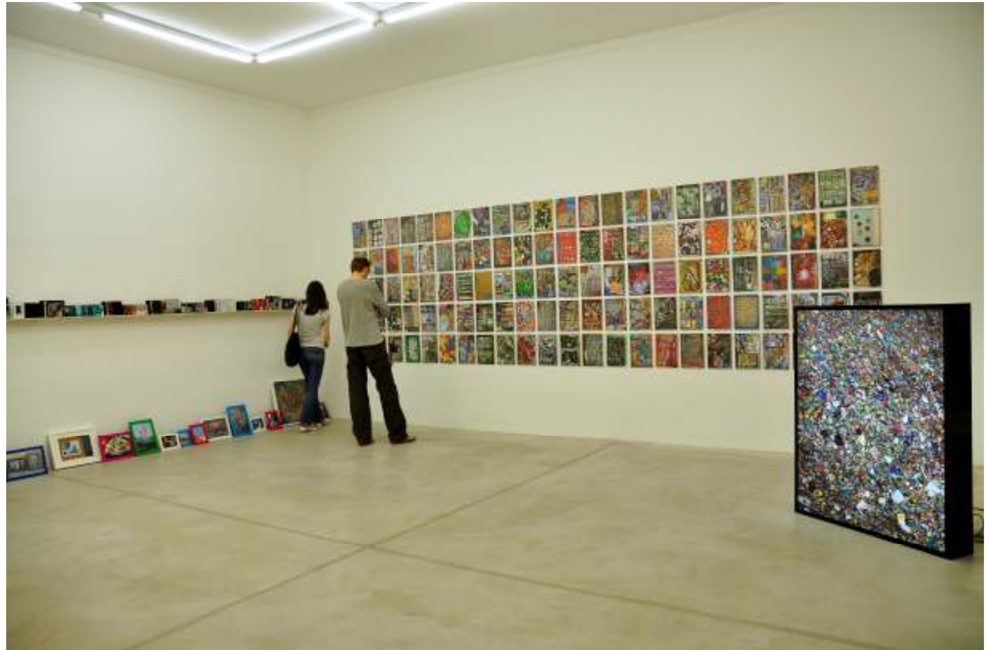
Installation view, Galerie Zimmermann Kratochwill f.l.t.r.: thoughts collected, recollected , 2007; inventory , 2010, 115 c-print on paper; a few of my favourite things , 2010/2011

Durch die Vielzahl und Diversifikation der Abbildungen verweist Yu darauf, dass Objekte nicht zwingendermaßen für sich selbst funktionieren, sondern als Teil eines Ganzen zu verstehen sind. Sie verbirgt nichts und trotzdem erscheinen ihre Fotografien wie Inszenierungen. Die ästhetische Wertung basiert auf der vergegenständlichten Sinnlichkeit von Objekten, welche Yu als selbstverständlich annimmt und auch so darstellt. Unter anderen zeigt MM Yu a few of my favourite things - Fotografien von Müll, common oddities sozusagen.