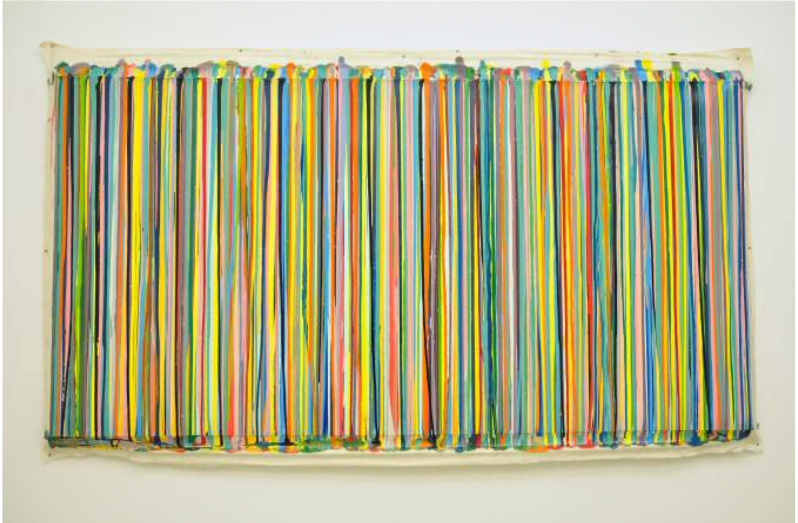
If you could hear a pin drop | 2011 | enamel on canvas | 213,5x108,5 cm

Yu's Malerei setzt sich mit Farbstudien auseinander und knüpft an den Abstrakten Expressionismus der 1940er und 50er Jahre an. Yu's drip paintings wirken wie Dokumente des zufälligen Aufeinandertreffens von Leinwand und Farbe. Nicht selten tauchen sie in Ihren Fotografien wieder auf oder dienen als Grundlage für Videoarbeiten.